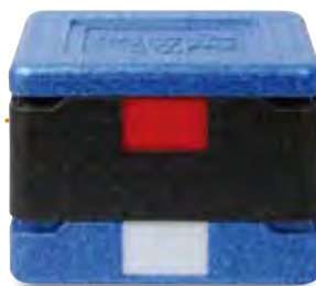
13625 (BOX) + 13683 (TOP)