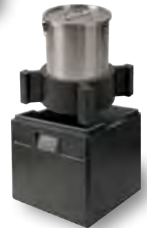
12199 Insert pour élément rond / Adattore tondo

Conteneur pour pizza avec bossages sur la structure du fond pour une meilleure circulation de l'air. Nuova superficie interna. Contenitore per pizza con sistema speciale per la circolazione dell'aria.